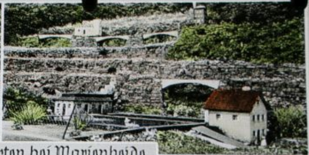
Märchenwald Gogarten bei Marienheide